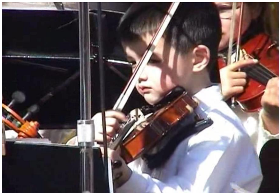
Fig. 7. Violinista de la orquesta infantil en Viola chilensis .