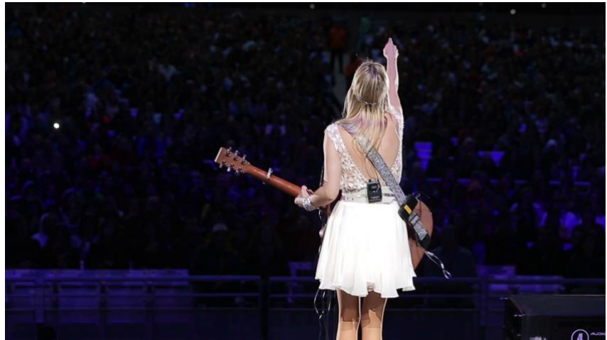
Fig. 2. Nicole en el Festival de Viña del Mar en Panal vivo .

Lo que Panal vivo articula, principalmente con material de archivo, Mon Laferte: Un alma en pena lo logra con una serie de acciones registradas expresamente para la cinta: la artista visita su antiguo barrio en la región de Valparaíso y la tumba de su abuela en el cementerio de Playa Ancha, pasea con sus sobrinos por diferentes lugares y asiste a una tanguería donde solía ir cuando pequeña junto a su abuela. Mediante el montaje transitamos permanentemente entre estos momentos de la vida personal y su faceta pública en conciertos. A través de la edición se articulan las dimensiones pública y privada de Mon Laferte. Así, los registros de lo privado promueven una vez más el tópico de la biografía artística en que detrás de la imagen pública triunfadora hay una vida de esfuerzos y sinsabores (Waisman 184).