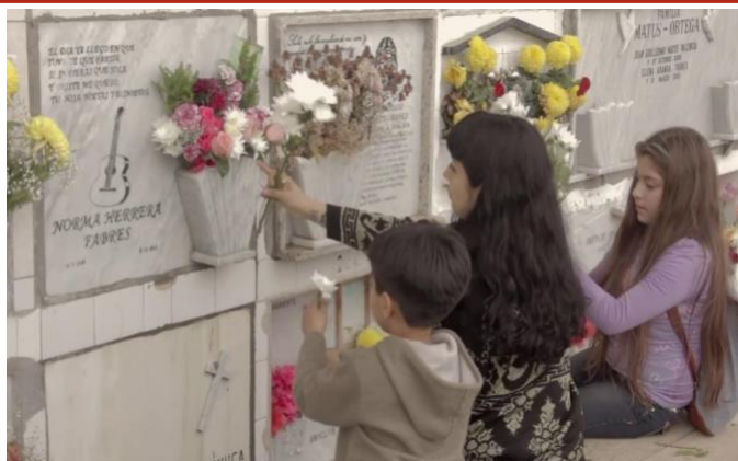
Fig. 4. Mon Laferte en la tumba de su abuela junto a sus sobrinos en Mon Laferte: Un alma en pena .